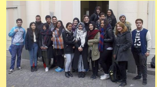
11. Klasse im Schuljahr 2015/16